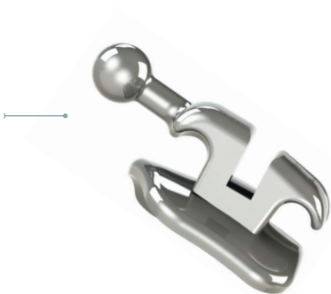
Ein-Stück-Bracket (MIM technology)